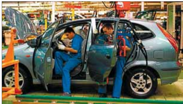
Cadena de muntatge a la planta que Nissan té a la Zona Franca de Barcelona

Aquesta és la primera conseqüència de la reducció en un 7,3% de la pro-