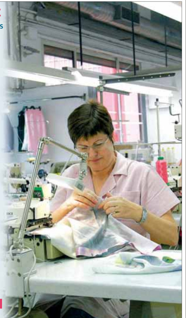
CRISTINA FORES/GRÀFIC: AVUI